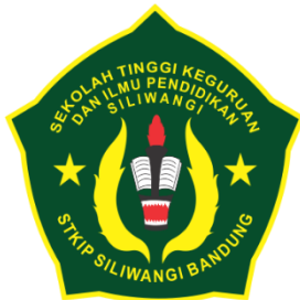
Latar Bahasa Indonesia